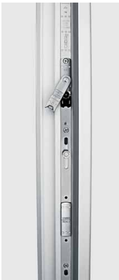
Un ferrage plus rapide grâce au pré-montage de l'élément tri-fonctions

Le système activPilot a été développé avec pour objectif de garantir une mise en œuvre simple et rapide, quelle que soit la taille de votre entreprise. Il convient à toutes les tailles d'entreprises. La simple réduction du nombre de pièces constructives au sein de vos processus de travail permet déjà une optimisation de la production du point de vue économique, et une gestion globale des stocks efficace.