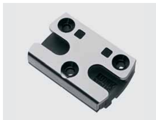
Gâche de sécurité : le concept modulaire des pièces du dormant permet d'individualiser les niveaux de sécurité.