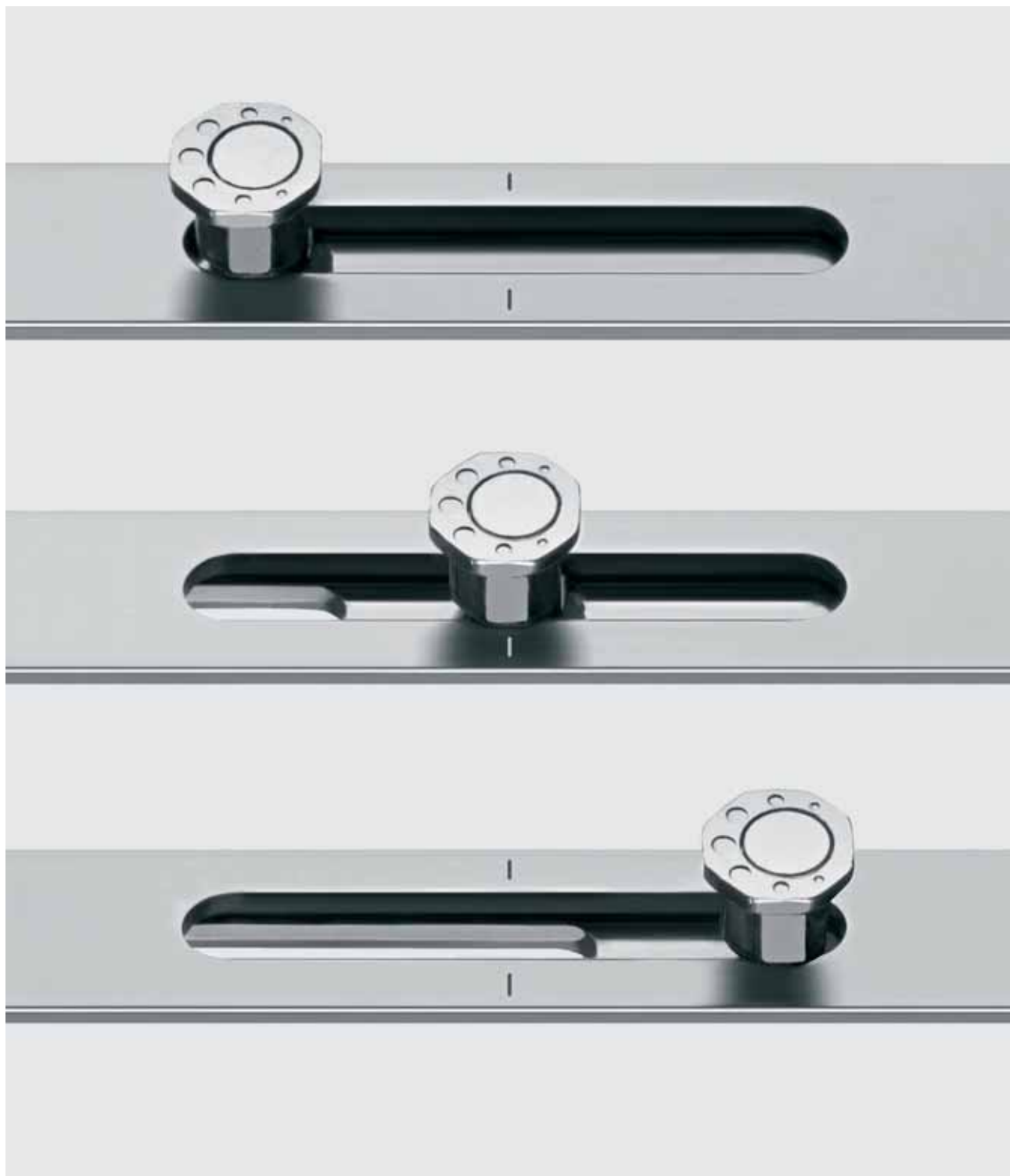
La longue course du galet garantit un verrouillage sûr et un fonctionnement durable.