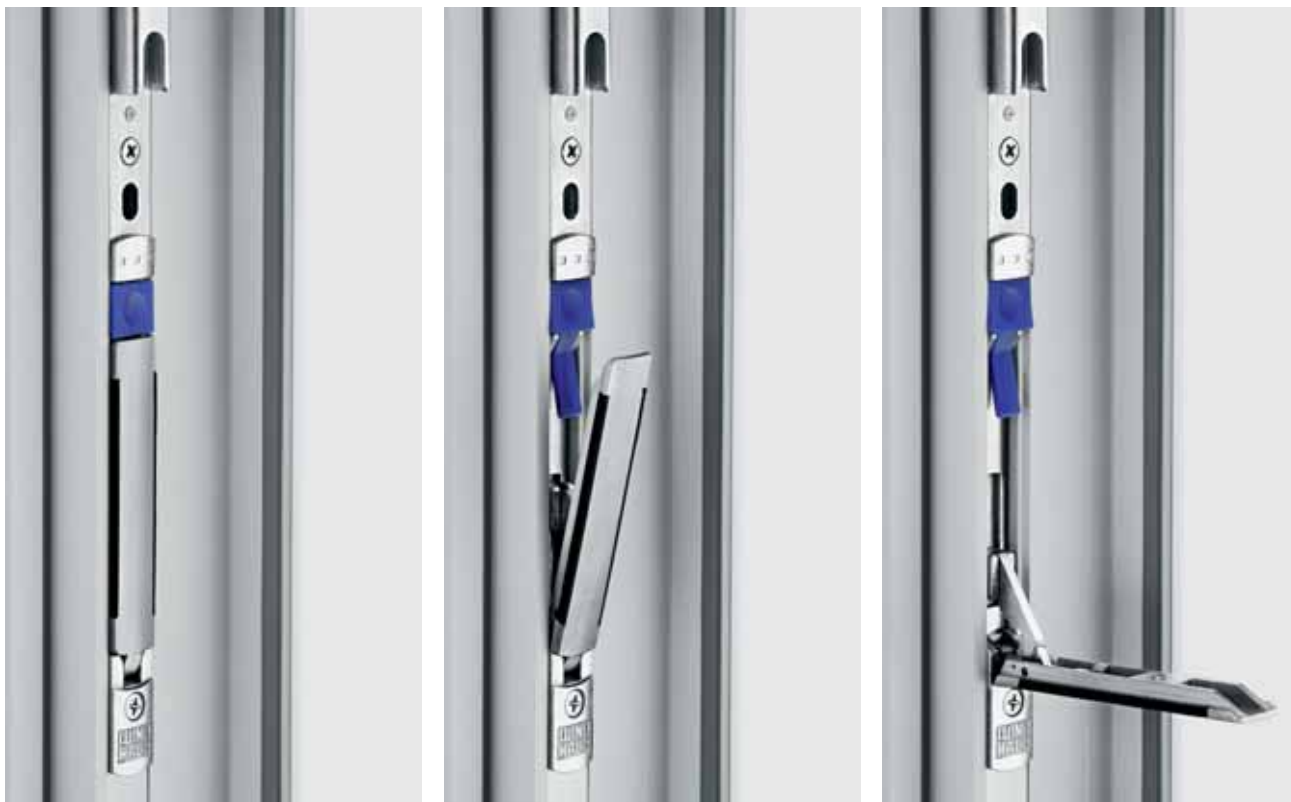
La touche de déverrouillage spéciale permet d'ouvrir plus facilement les fenêtres dotées de crémones pour semi-fixe.