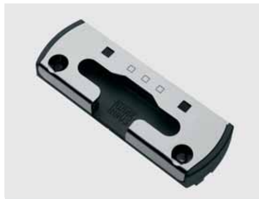
Gâche de pivot de sécurité avec pont en acier.

Enfin, il existe une sécurité bien particulière: la qualité Winkhaus, la qualité de nos ferrures bien sûr mais également la qualité de notre culture de l'innovation. Cette garantie est assurée non seulement par les défis que nous relevons, mais également par les innombrables tests effectués avant l'introduction sur le marché. Nous avons ainsi créé pour nous-mêmes une qualité de tests beaucoup plus sévères que les méthodes d'essais règlementés. Cela nous permet d'être préparés au mieux à tous les contrôles officiels. Il va de soi que le système activPilot a également passé avec succès de nombreux tests auprès des organismes externes certifiés. Résultat : un essai d'endurance RAL réussi, ainsi que des tests de classe WK 2 concernant différents systèmes de profils et tailles de fenêtres